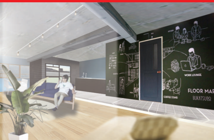
完成イメージパース