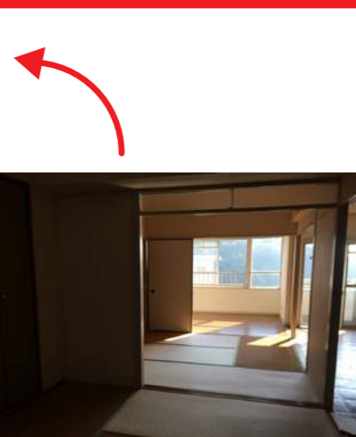
神戸のマンションの一室

NEWS 1 ほったらかしになってお困り物件ありませんか？ ディーマンと一緒に有効活用しましょう！ プランで売れる！オーダーマンション！ プロジェクト開始しました！