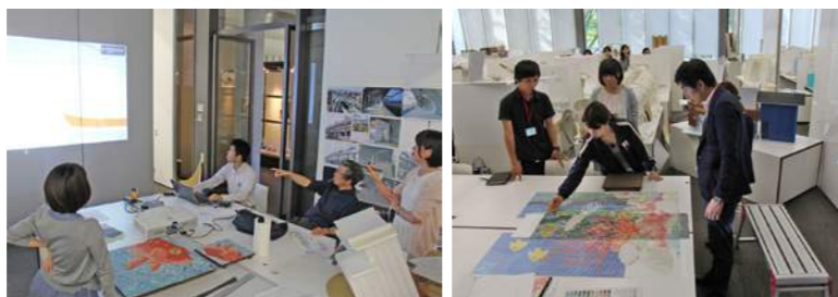
弊社も武庫川女子大学と学生たちと連携して取り組みを行っています。

これから会社を伸ばしていきたいとお考えの経営者様、是非ご参加してみませんか？皆さまからのご応募お待ちしております。