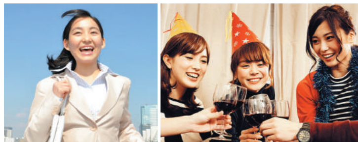
一人では気付かなかった自分の能力・可能性を同じ環境の仲間が気付かせられる

お問い合わせ (株)キャリアアップ ●TEL 06-6477-6667 ●MAIL info@crewso.co.jp