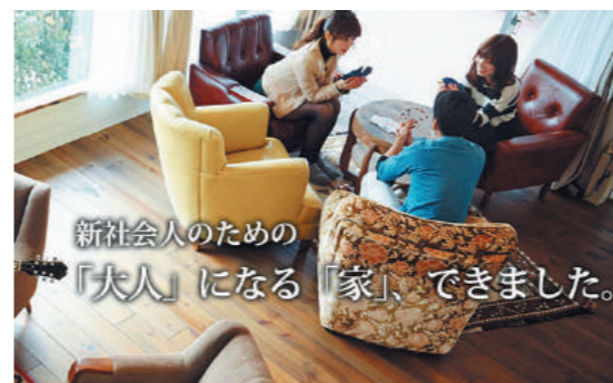
新しい社宅のカタチがここに

この度、私もディーマングループは少子高齢化が進む社会の中で、街や企業が活力を取り戻すには、若者達が安心して「住む」「働く」その両方が叶えられる基盤作りが必要と考えました。その答えが「社宅シェアハウス」です。 地方から出てきた若者は就職した後、独りで住むことが多いです。知り合いもおらず、慣れない土地で仕事に没頭することは、「仕事場」と「二人の部屋」の往復とになってしまいう可能性が高まることにつながります。その場合、なかなか同世代と話す機会もないので、「孤立化」してしまう危険性が生じてくるのです。すると、どうしても労働意欲が下がってしまい、残念なことに短期離職に繋がるケースも出てきます。 そこで、私どもが提案する社宅シェアハウスでは、「社宅」と「シェアハウス」を融合させることで、若者達に「仕事」「住まい」「仲間」の三つを同時に手に入れる環境を手に入れることができます。それぞれが 悩みを打ち明け、喜びを分かち合い、互いにサポートし合うことで切磋琢磨が生まれ、頑張る気持ち芽生えるものと考えております。 そして、ひいてはそれが、企業にとってはオシャレで魅力的な「社宅付き」という付加価値が人材採用の武器として雇用の機会につながり、若手社員にとっては一緒に住まう仲間の存在によって人間性がより磨かれていく人財育成の場へとつながるのです。 「老朽化で使用しなくなった社宅」「親から受け継いだ土地や建物を自分の代で手放したくない」 などの理由で、土地や空き家の活用をご検討しているのであれば、これを機に社宅シェアハウスと生まれ変わらせてみるのはいかがでしょうか？