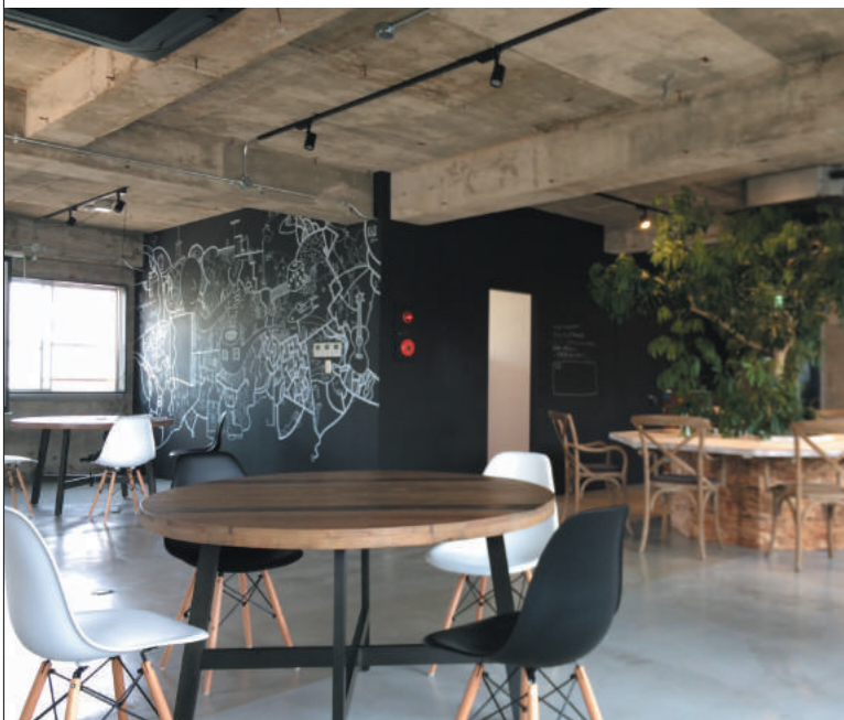
おしゃれな解放スペースも利用できる

NEWS 2 第1弾！「女子限定シスターハウス」 新社会人女性を応援！今回は第1弾として女子限定の社宅「シェアハウス「sister 尼崎」」をご紹介します。 こちらは元々築38年の老朽化した社宅でした。部屋が20室もあったのに対して、稼働していたのはたったの1室だけだったので、せつかくの建物の魅力が活かされておらず、価値は失われていくばかりでした。何とかして本来の価値を再び取り戻したい。そこでリノベーションによって再生を図ったのです。その結果